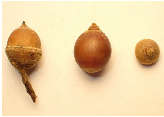
ຈາກຊ້າຍຫາຂວາ: ໝາກແກ່; ໝາກແຫ້ງເປືອກແຂງແກ່; ໝາກແຫ້ງເປືອກແຂງ.

ກາບຫຸ້ມໝາກ (ຮູບຖ້ວຍ) ຫຸ້ມ 1/3 ຂອງໝາກ, ມີລັກສະນະເປັນຊິງ ກະບອກ, ຂວັນຮຽວແຫຼມເລັກນ້ອຍ, ມີເສັ້ນຜ່າສູນກາງແຕ່ 6–8 ມິນລິເມັດ ແລະ ຍາວ 4–5 ມິນລິເມັດ, ດ້ານໃນນຸ້ມ ແລະ ດ້ານນອກມີຂົນ, ດ້ານນອກມີ 5–6 ໂຊນທີ່ມີຮອຍຫຍັກ, ຮູບແຂ້ວ. ໝາກ ຮູບຮີ, ຍາວແຕ່ 8–9 ມິນລິເມັດ ແລະ ມີເສັ້ນຜ່າສູນກາງ 5 ມິນລິເມັດ, ມີຂົນສັ້ນອ່ອນນຸ້ມປົກຄຸມ, ປາຍຕິ່ງ ໂຄ້ງຮອບໂດຍວົງກົມ ແລະ ມີຮວງຮັບເກສອນໜາ 3 ອັນ, ເກິ່ງບໍ່ມີການ. ຮອຍນູນຂຶ້ນ , ຂະໜາດຂ້ອນຂ້າງໃຫຍ່. ໃບລ້ຽງ ໂດຍທົ່ວໄປເຊື່ອມຕິດກັນ.